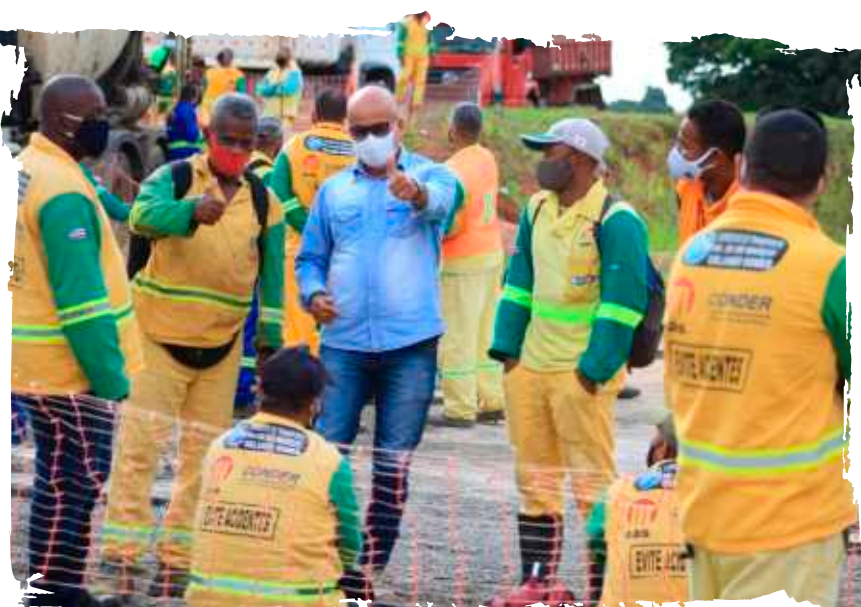
Unidade dos trabalhadores é fundamental para os avanços na CCT

posição de não aceitar a retirada de nenhuma cláusula, além de lutar pelo reajuste com o índice da inflação.