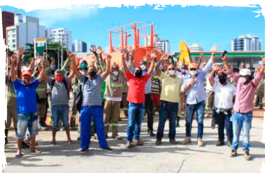
Mobilização marca assembleia com os trabalhadores da obra do BRT de Salvador

As negociações da Campanha Salarial 2021 foram intensas, o sindicato patronal – Sinicon apresentou uma pauta regressiva que visava a retirada das conquistas da Convenção Coletiva de Trabalho, a exemplo do aviso prévio indenizado, contrato de experiência e as cláusulas de saúde e segurança. No entanto, o sindicato manteve a