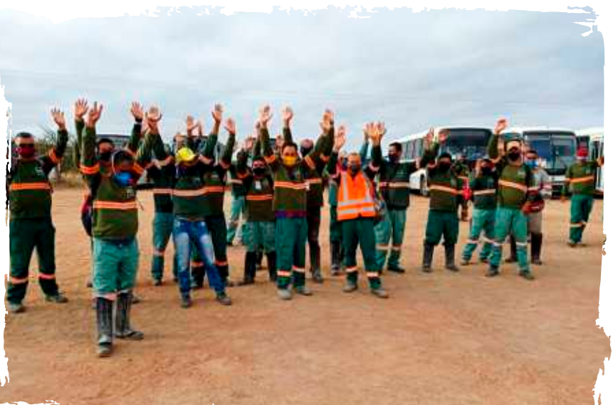
Assembleia com os trabalhadores da empresa Snef fotovoltaica na cidade de Juazeiro