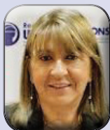
Presidenta: Marta Pujadas - UOCRA Argentina